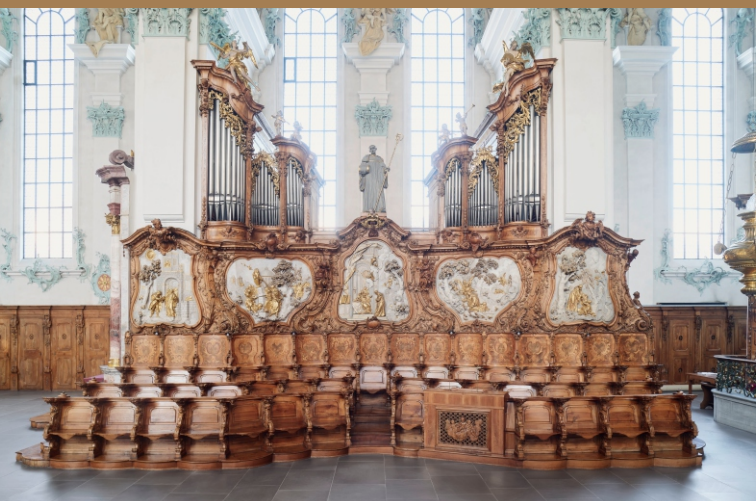
Evangelienorgel – Nordseite