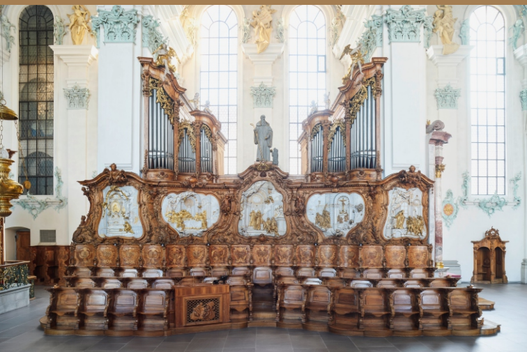
Epistelorgel – Südseite